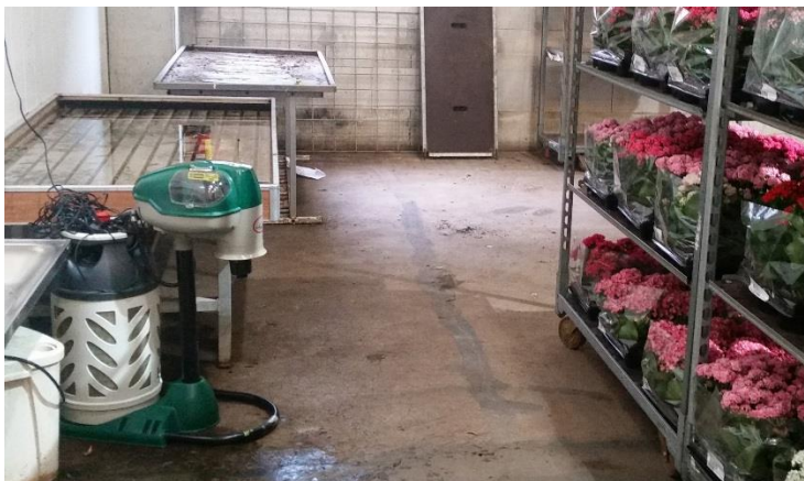
Figur 2.1. Myggfelle av typen Mosquito Magnet plassert inne i importlokalet. Fella trekkjer til seg hoinsekt ved å frigjere karbondioksid omdanna frå propan, og mygg som kjem nære nok blir så søge inn i eit nett, som på ein støvsugar.

I perioden 1.6.–24.8.2016 hadde vi feller for blodsugande insekt plassert innandørs i plantesentra på Skedsmo og Vollebakk (figur 2.1). Denne felletypen samlar inn hoinsekt som er på jakt etter blod ved å bruke CO 2 som lokkemiddel i kombinasjon med eit duftstoff.