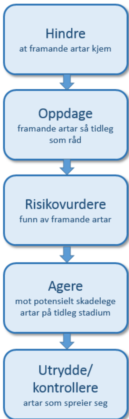
Figur 3.2. Fasar i ein handlingsplan mot framande artar.

Ein handlingsplan mot framande artar kan såleis delast inn i ulike fasar langs ei tidslinje (figur 3.2):