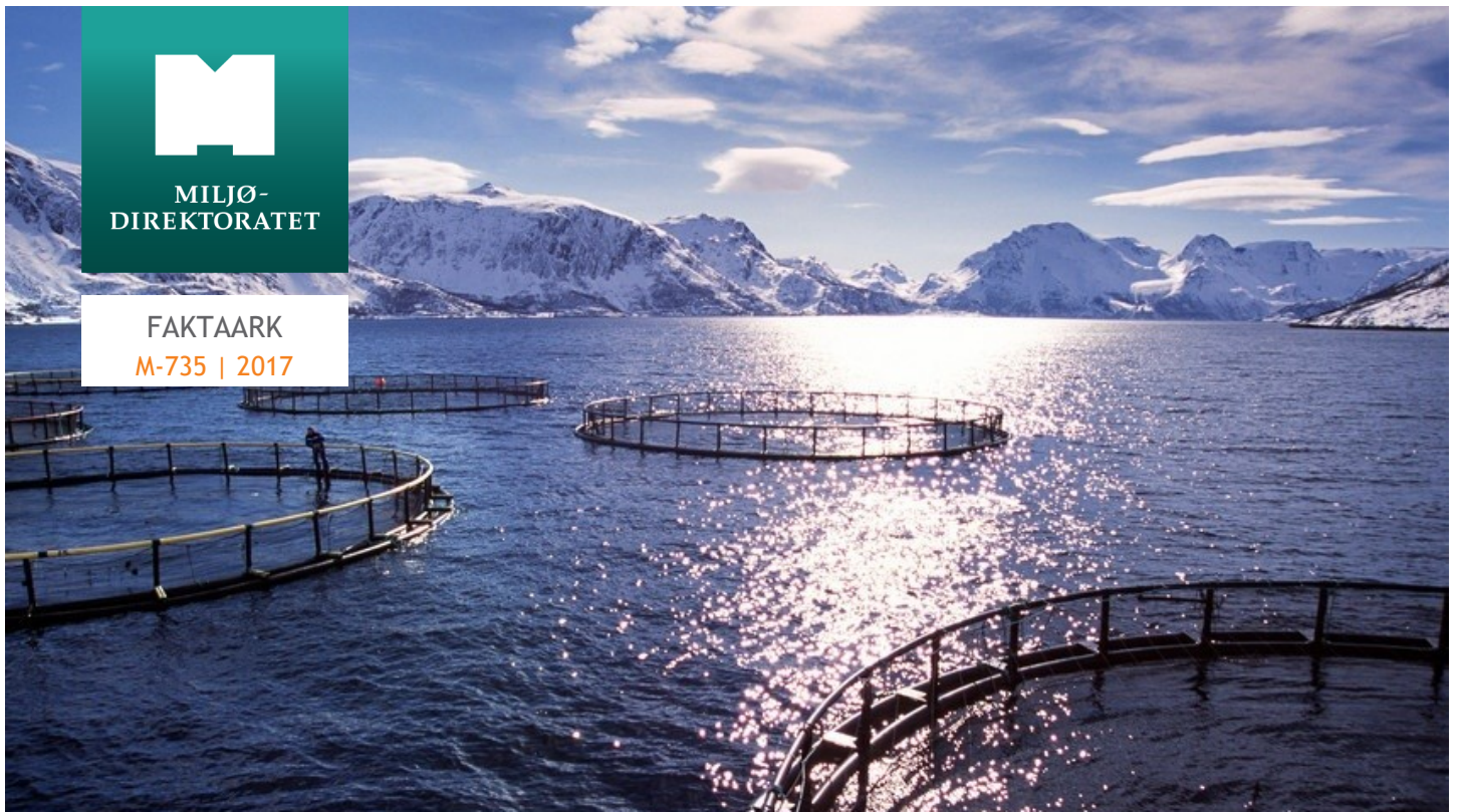
Oppdrettsanlegg i sjø.