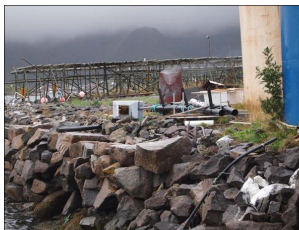
Avfall og utrangert utstyr skal ikke forurense, men leveres til godkjent mottak.