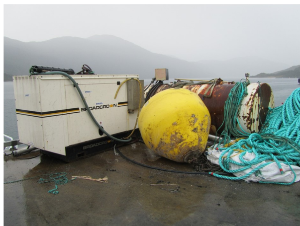
Plassering av utstyr som spilloljetanker må risikovurderes.

For selskap med flere anlegg eller der flere anlegg ligger tett, kan det være lurt å sammenlikne resultater for miljø og vurdere felles tiltak for å redusere miljøpåvirkningene.