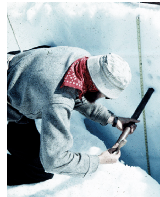
[Bildetekst] Bildetekst.

Nonsedis eos dest omnieni stiisqui net re voluptaspe