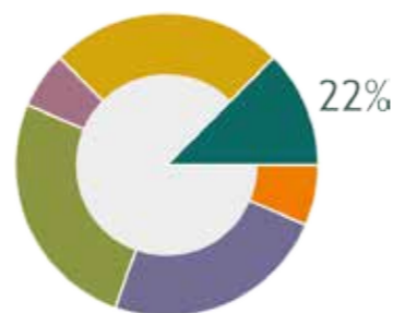
Grafen viser gjennomsnittene for denne typen fordelt på standardveiblene som gjelder per 2014