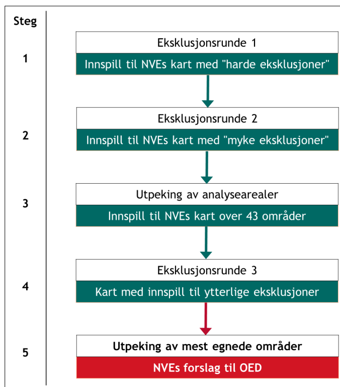
Figur 1: "Nasjonal ramme" i 5 steg. Miljødirektoratets bidrag i grønt. NVE har et helt selvstendig ansvar for siste ledd. Arbeidet med kunnskapsgrunnlaget kommer i tillegg til oppgavene i figuren.

Arbeidet med utpeking av egnede områder har skjedd gjennom fem steg (jfr. Figur 1). Det startet med eksklusjon av områder som ble vurdert som "ikke egnet" (steg 1+2). Deretter ble det det pekt ut 43 analyseområder i steg 3 ut fra en grov vurdering av produksjonspotensial, kraftnett og de nevnte eksklusjonene (2).