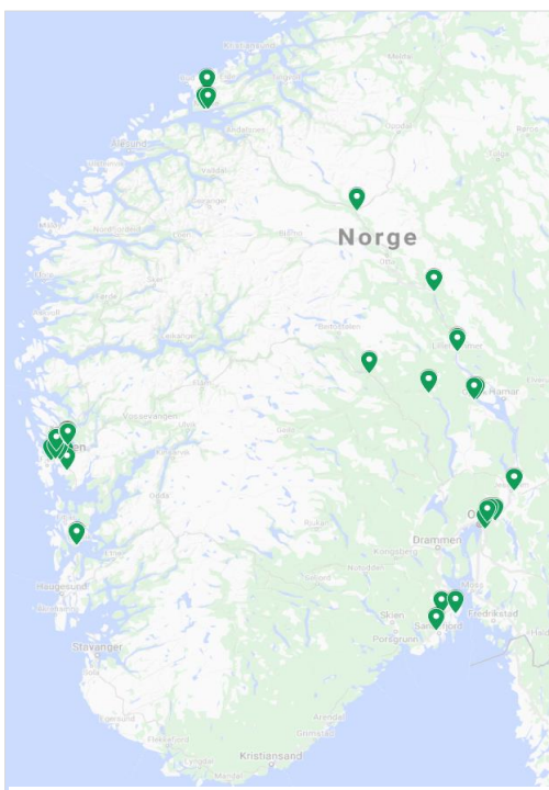
Figur 1 Geografisk plassering av tilsynene.

Aksjonen ble gjennomført av fylkesmannen i Hordaland, Møre og Romsdal, Oslo og Akershus, Oppland og Vestfold i uke 45-47 2018. Det ble gjennomført 35 tilsyn demonstrert geografisk i figur 1.