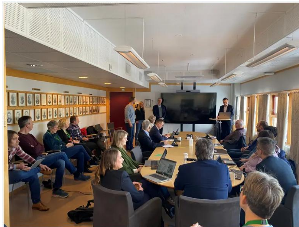
Ledelsen i Valinor og Norsk industriutvikling orienterte om planene i formannskapet onsdag.