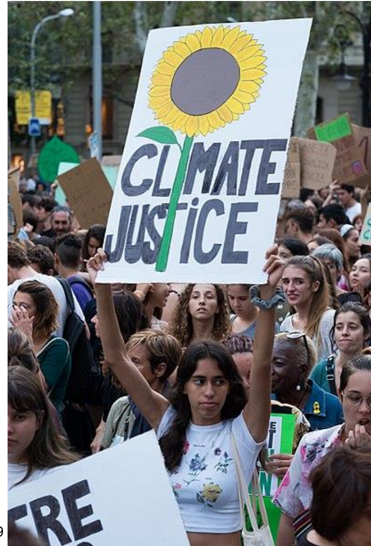
September 27 2019