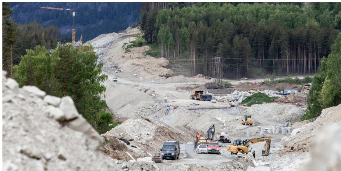
Anleggsarbeidet på E6 mellom Kvam og Sjøa i Gudbrandsdalen.