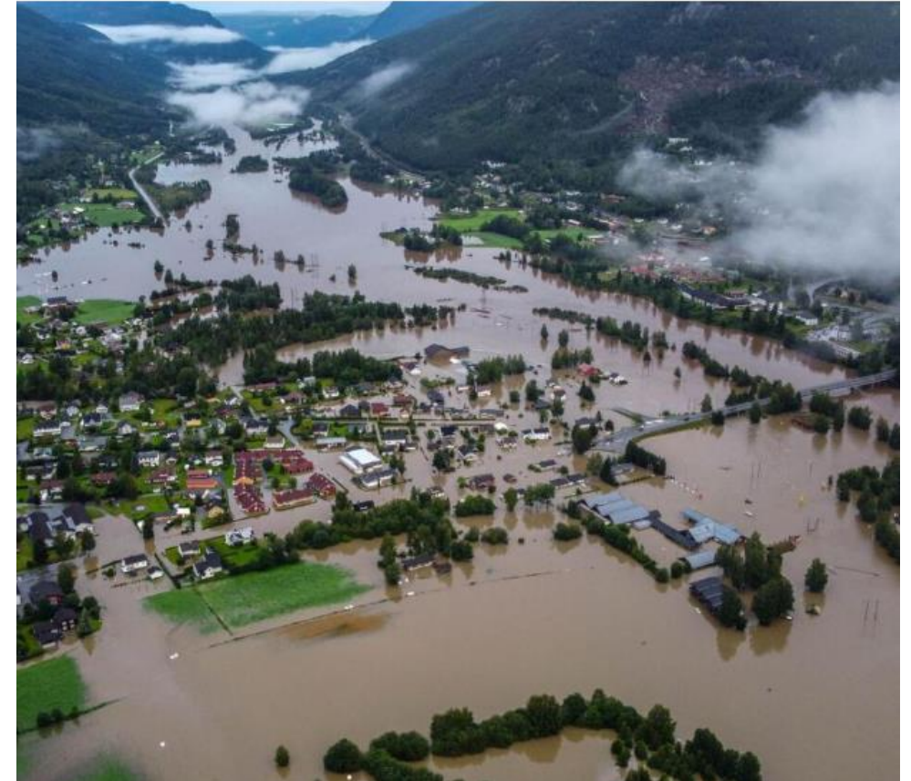
Nesbyen under ekstremværet Hans.