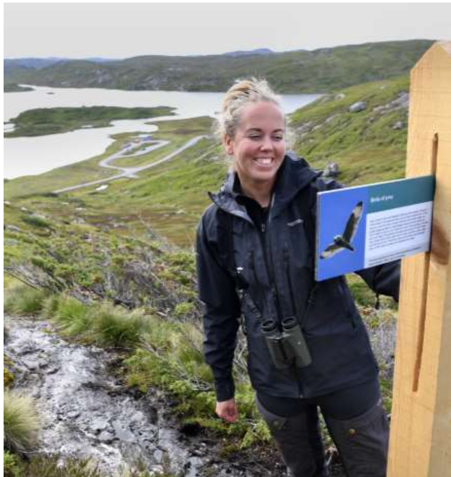
Håhellervatnet, SVR, Foto: Pål Christensen