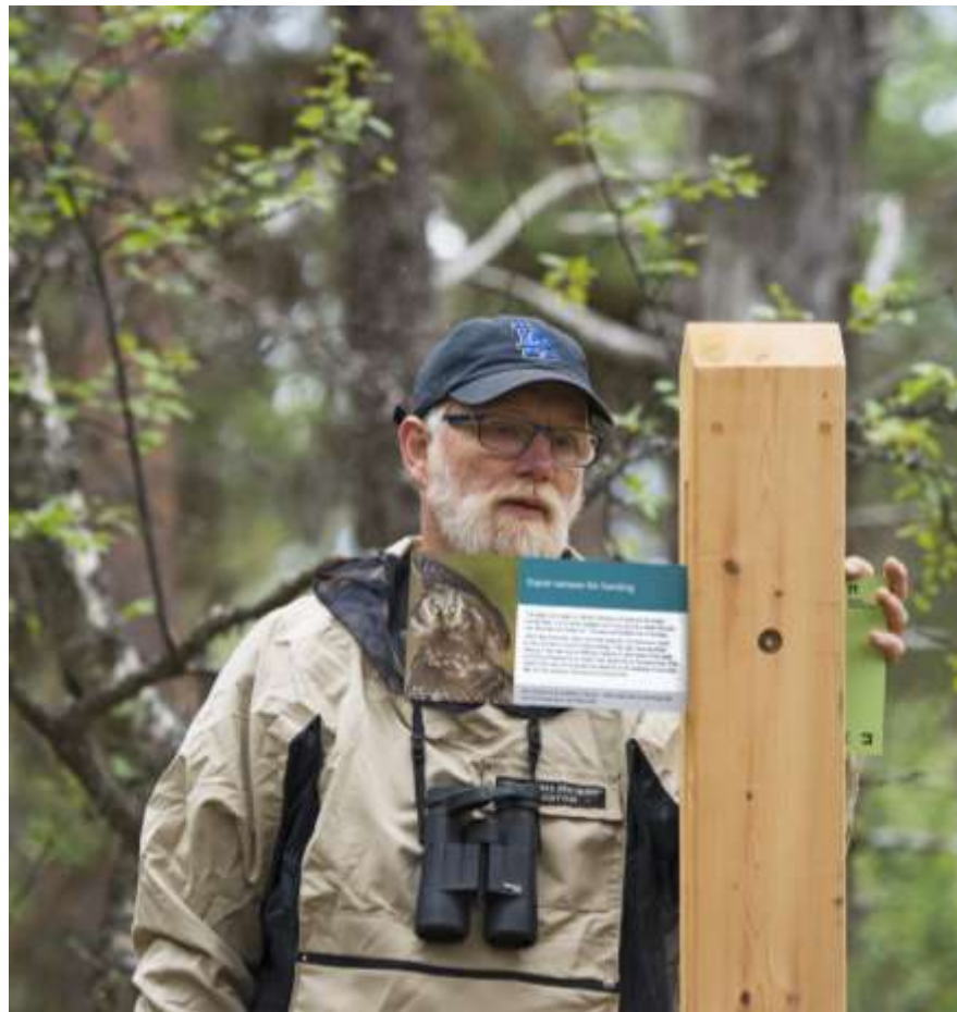
Gutulia nasjonalpark