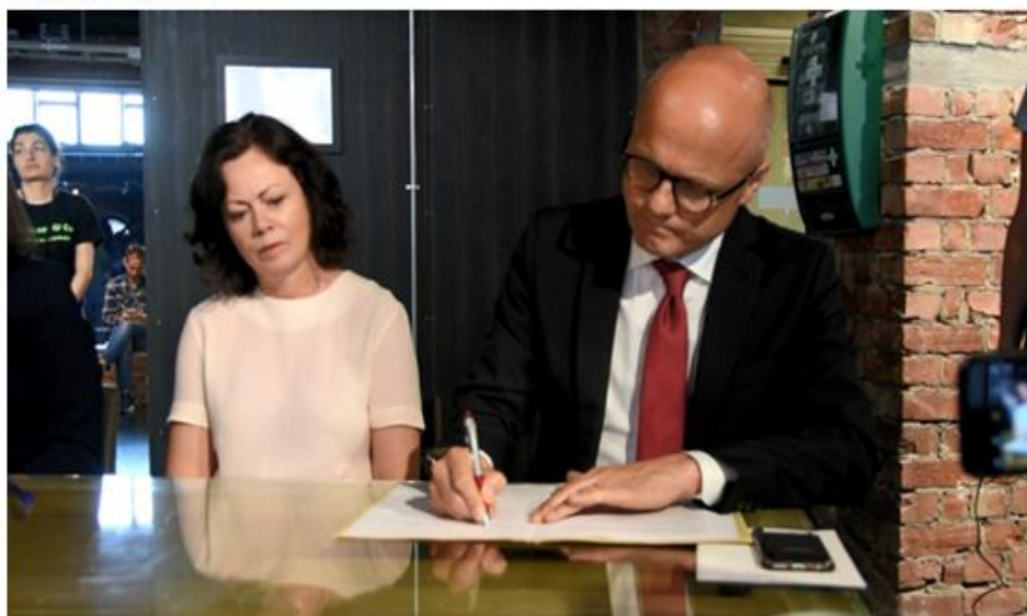
Klima- og miljøminister Vidar Helgesen og forbrukerminister Solveig Horne signerer avtalen om matsvinn.

Regjeringen og den norske matbransjen har undertegnet en avtale om å redusere matsvinnet i Norge med 50 prosent innen 2030.